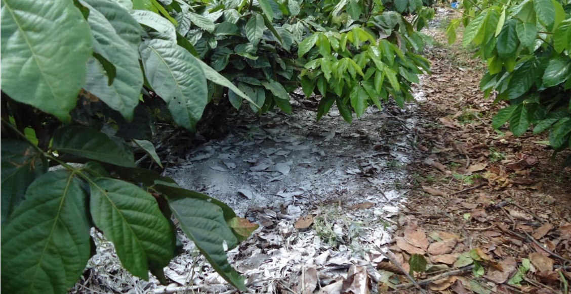
Figura 2 – Aplicação de “Calcário + Gesso” do modo à lanço, em experimento conduzido pela Embrapa Amazônia Ocidental na Agropecuária Jayoro Ltda.

Por sua vez, o calcário, além de ter fornecido os nutrientes Ca e Mg, teria promovido um pH mais favorável para a disponibilização dos macronutrientes e de alguns micronutrientes na solução do solo, levando a aumento da absorção deles.