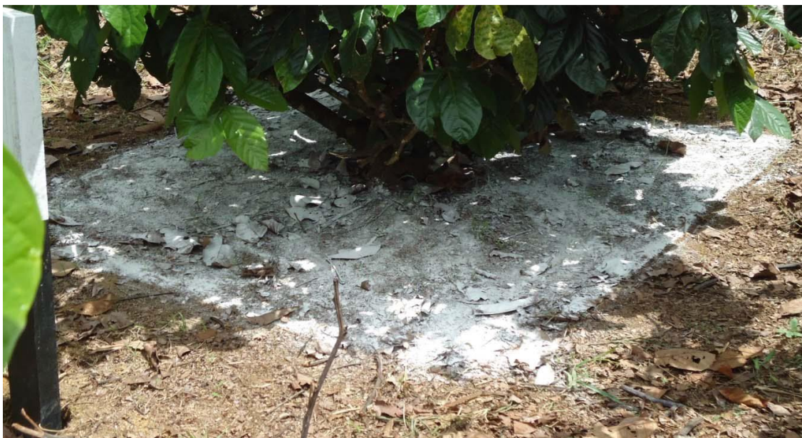
Figura 4 – Aplicação de “Calcário + Gesso” do modo localizado, em experimento conduzido pela Embrapa Amazônia Ocidental na Agropecuária Jayoro Ltda.